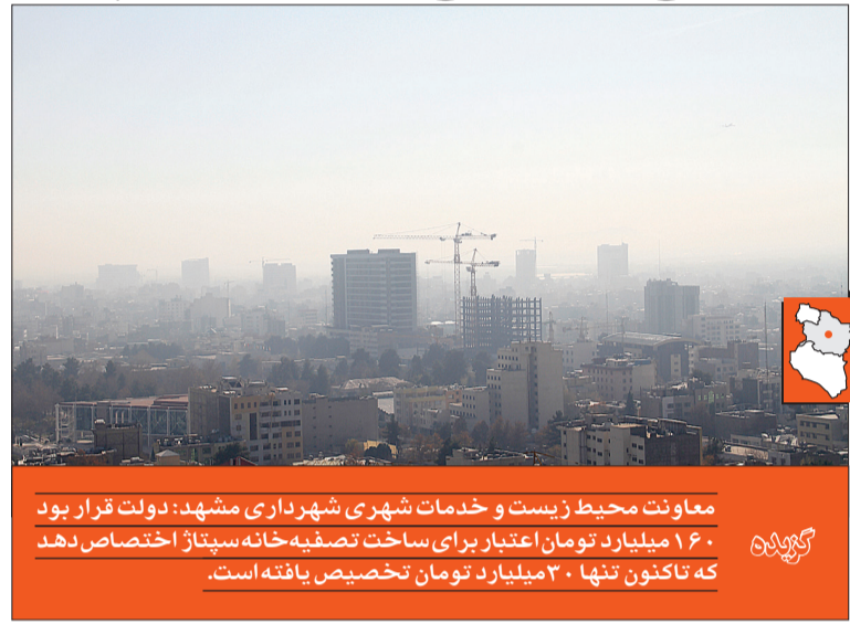
معاونت محیط زیست و خدمات شهری شهرداری مشهد: دولت قرار بود ۱۶۰ میلیارد تومان اعتبار برای ساخت تصفیه‌خانه‌سپتاز اختصاص دهد که تاکنون تنها ۳۰ میلیارد تومان تخصیص یافته است.

وظیفه شهرداری نیست؛ اما مدیریت شهری به آن ورود پیدا کرد. دولت قرار بود ۱۶۰ میلیارد تومان اعتبار برای این امر اختصاص دهد که تاکنون تنها ۳۰ میلیارد تومان تخصیص یافته است.