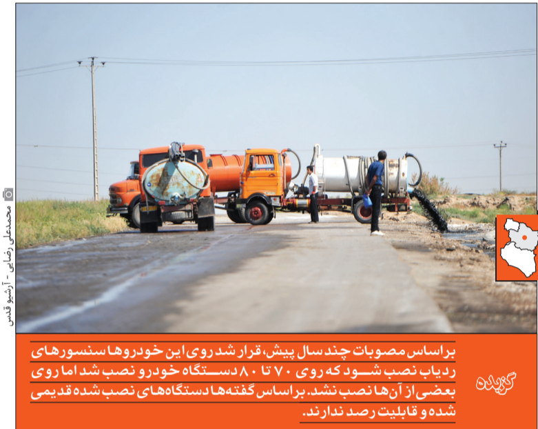
بر اساس مصوبات چند سال پیش، قرار شد روی این خودروها سنسورهای ردیاب نصب شود که روی ۷۰ تا ۸۰ دستگاه خودرو نصب شد اما روی بعضی از آن‌ها نصب نشد. بر اساس گفته‌ها دستگاه‌های نصب شده قدیمی شده و قابلیت رصد ندارند.

شهری باشد و فاضلاب حمل شده صنعتی یا بیمارستانی نباشد. شمس بیان اینکه تخلیه باید در منطقه سبز انجام شود، متذکر می‌شود: تنها راه مدیریت این امر، نصب سیستم‌های AVL است تا علاوه بر ردیابی محل حمل و تخلیه، وزن تانکر در مسیر نیز مشخص شود.