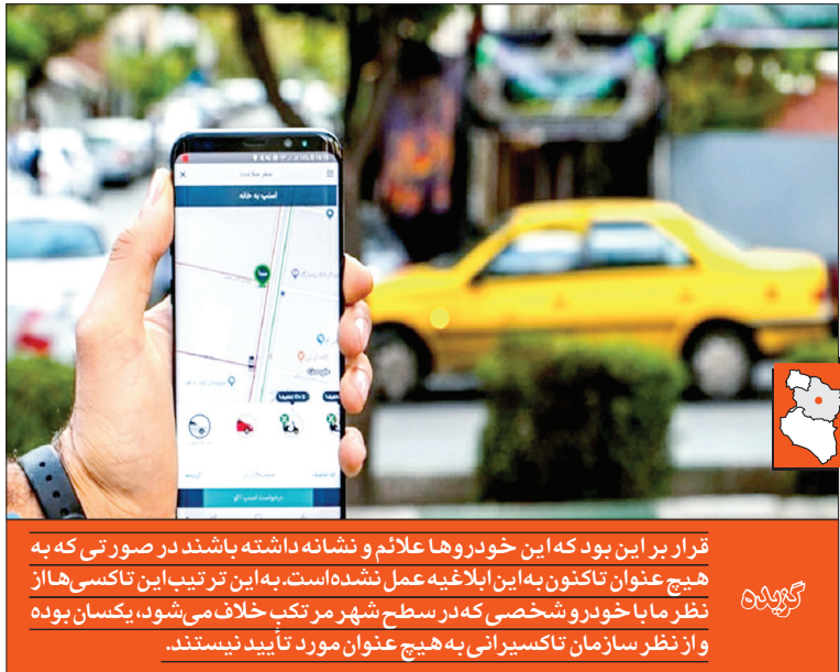
قرار بر این بود که این خودروها علائم و نشانه داشته باشند در صورتی که به هیچ عنوان تاکنون به این ابداعی عمل نشده است. به این ترتیب این تاکسی‌ها از نظر ما با خودرو شخصی که در سطح شهر مرتکب خلاف می‌شود، یکسان بوده و از نظر سازمان تاکسیرانی به هیچ عنوان مورد تأیید نیستند.

همان‌طور که از نامش برمی‌آید برای مواقعی است که مسافر عجله دارد و می‌خواهد شانس پذیرفته شدن درخواست سفرش بالاتر برود. روابط عمومی اسنپ در پاسخ به این سؤال که آیا اسنپ از قوانین تاکسیرانی برای رانندگانش در خصوص قیمت‌گذاری، امنیت مسافران و... تبعیت می‌کند، گفت: تاکسی‌های اینترنتی براساس «دستورالعمل نظارت بر چگونگی فعالیت ارائه‌دهندگان خدمات هوشمند مسافر» که از سوی وزارت کشور تدوین و ابلاغ شده، فعالیت می‌کنند. همچنین همه‌مجوزهای اسنپ از سوی اتحادیه کشوری کسب و کارهای مجازی از زیرمجموعه‌های اتاق اصناف ایران و با نظارت وزارت صنعت، معدن و تجارت صادر شده است. وی در توضیح اعتبار ماهانه اسنپ به مسافران نیز گفت: ابتدا از روش‌های مختلف از جمله پیامک، تماس تلفنی، پوش‌نوتیفیکیشن و... به کاربرهایی که تسویه‌حسابشان به تعویق افتاده، یادآوری می‌شود تا صورتحسابشان را در بازه مقرر پرداخت کنند؛ اما اگر با وجود پیگیری‌های متعدد و اطلاع‌رسانی‌های انجام‌شده در خصوص پرداخت نکردن صورتحساب سرویس اعتباری، باز پرداخت توسط کاربر اتفاق نیفتد، اطلاعات عدم پرداخت کاربر به سامانه اعتبارسنجی با نظارت بانک مرکزی ارسال می‌شود و در اختیار سیستم بانکی کشور قرار می‌گیرد.