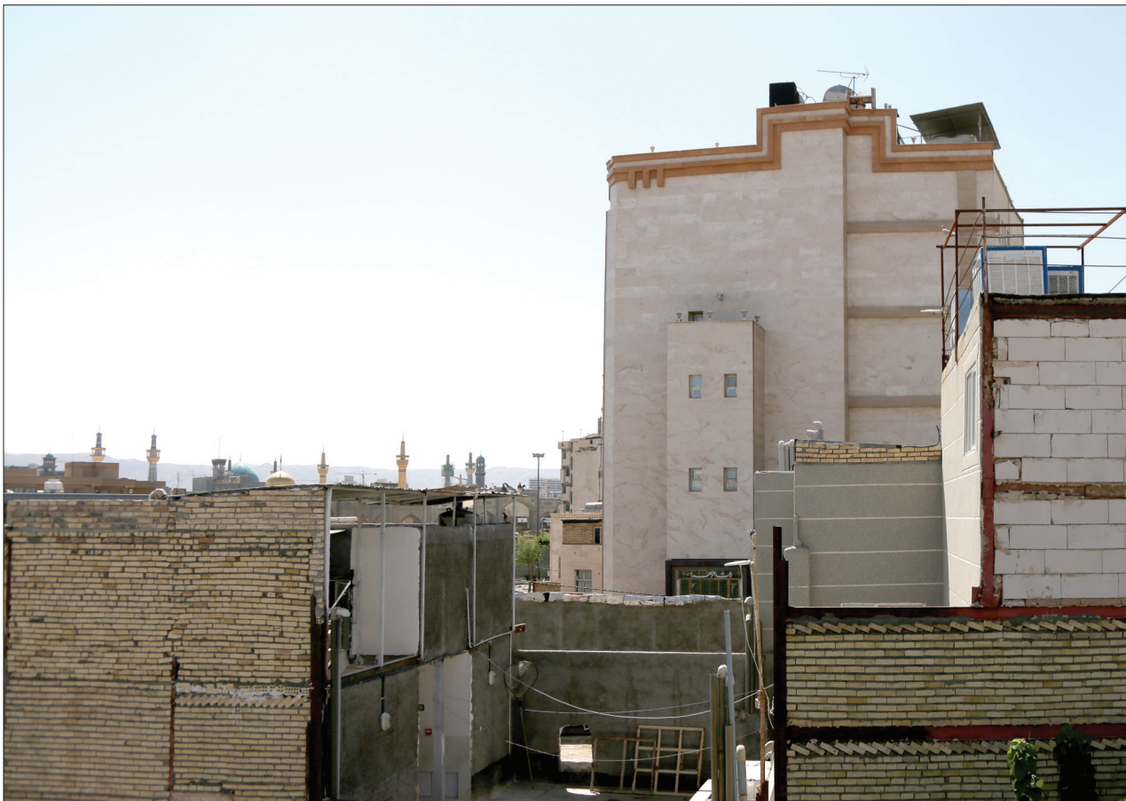
رحیم بیات / قدس

شهر دار منطقه در پاسخ به قدس این اقدام را قابل دفاع ندانست