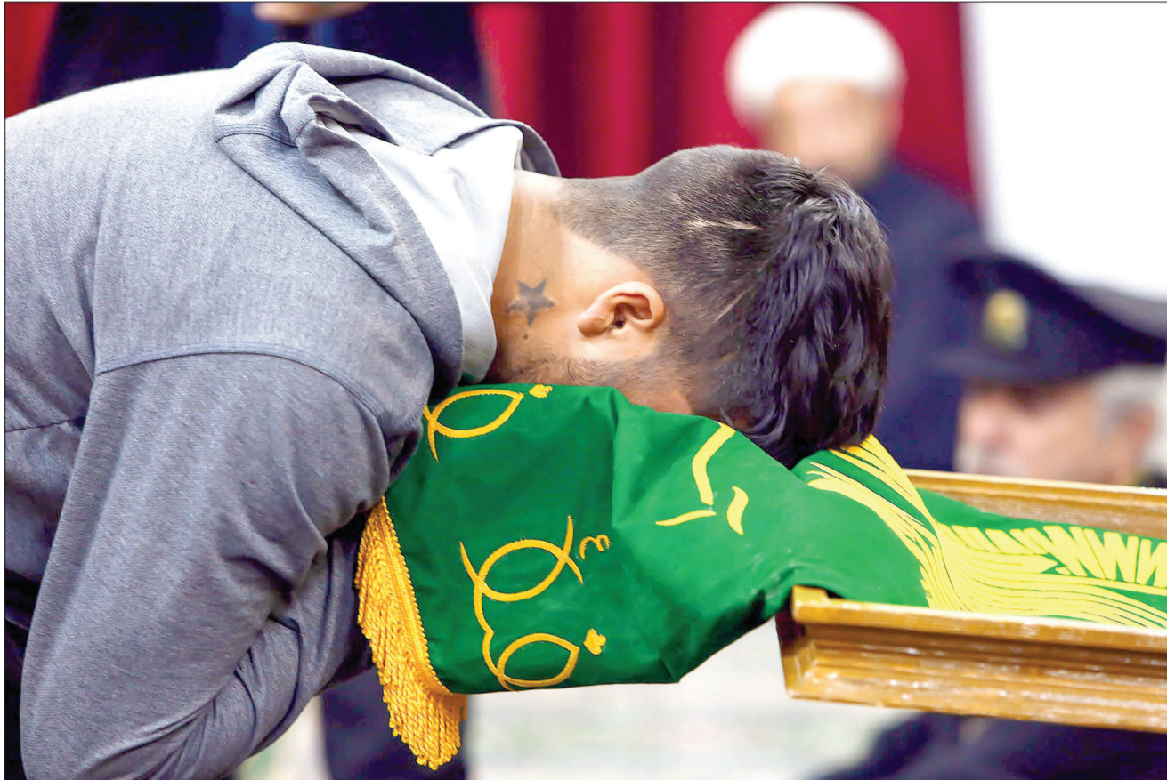
عاشق الصبر صمیمی