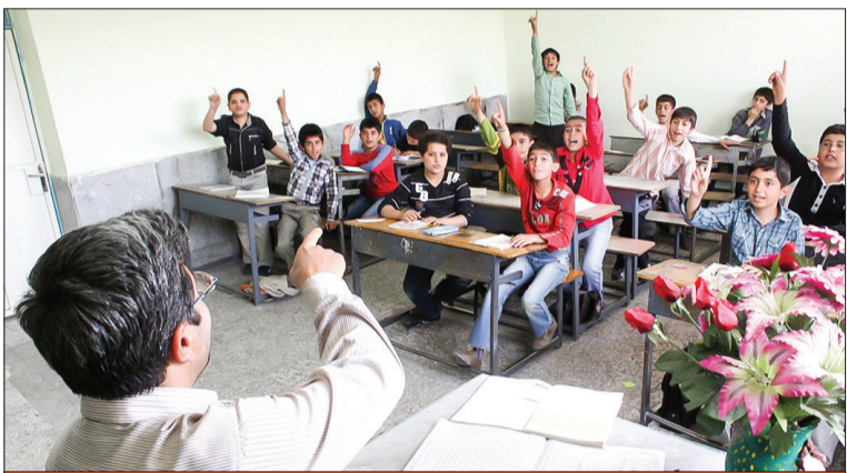
استفاده از ظرفیت اقتصادی مدرسه‌ها در قانون نادیده گرفته شده در حالی‌که مدیران مدرسه می‌توانند با استفاده از این ظرفیت، با برگزاری کلاس‌های علمی آزاد و فوق برنامه برای مدرسه ایجاد درآمد کنند.

وی با اشاره به اینکه براساس قوانین موجود، «اقتصاد مدرسه» به معنای درآمدزایی برای مدرسه‌های دولتی، تعریف نشده و پرداختن به آن ممکن نیست. می‌گوید: مدرسه بنگاه اقتصادی نیست که بتوان انتظار درآمدزایی از آن داشت. با این حال، برخی مسئولان و سیاست‌گذاران آموزش و پرورش تجربه کار در مدرسه را ندارند. به همین دلیل نمی‌توانند تصور کنند اداره مدرسه با چه چالش‌ها و مشکلاتی همراه است و حتی روشن نگه داشتن چراغ مدرسه هزینه دارد. بنابراین ممکن است هر راهکاری را ارائه کنند. در حالی‌که اگر شناخت کافی درباره اداره مدرسه داشتند متوجه بودند امکان اجرای بسیاری از طرح‌ها و برنامه‌هایی که آن‌ها به سادگی از آن سخن می‌گویند، در بیشتر مدرسه‌های دولتی غیرممکن است. به عنوان نمونه یکی از مسئولان قبلی آموزش و پرورش معتقد بود مدیران با اجاره دادن سالن ورزشی مدرسه به شورای محل در نوبت عصر یا روزهای تعطیل می‌توانند برای مدرسه درآمدزایی کنند. این درحالی‌است که تعداد زیادی از مدرسه‌های دولتی حتی برای استفاده دانش‌آموزان خود سالن ورزشی ندارند.