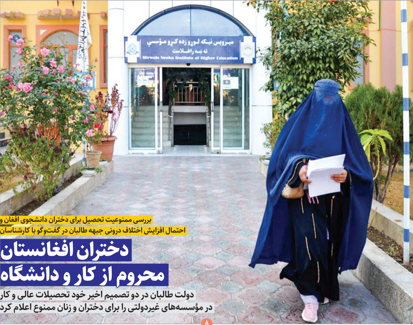
بررسی ممنوعیت تحصیل برای دختران دانشجوی افغان و احتمال افزایش اختلاف درونی جبهه طالبان در گفت‌وگو با کارشناسان