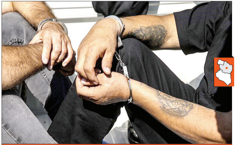
در بررسی سوابق مجرمانه این افراد شرور مشخص شد آن‌ها در جریان یک نزاع دسته‌جمعی در یکی از روستاهای محدوده جاده سیمان با استفاده از سلاح گرم و عربده‌کشی موجب رعب و وحشت اهالی شده‌اند.

آن‌ان دو قبضه سلاح وینچستر، یک قبضه کلت کمری، چهار قبضه چاقو و قمه کشف کردند. فرمانده انتظامی مشهد خاطر نشان کرد: متهمان که جرایمی از قبیل شرارت، ایجاد مزاحمت، استفاده از سلاح گرم، نگهداری و توزیع مواد مخدر، شرکت در نزاع‌های دسته‌جمعی و... را در