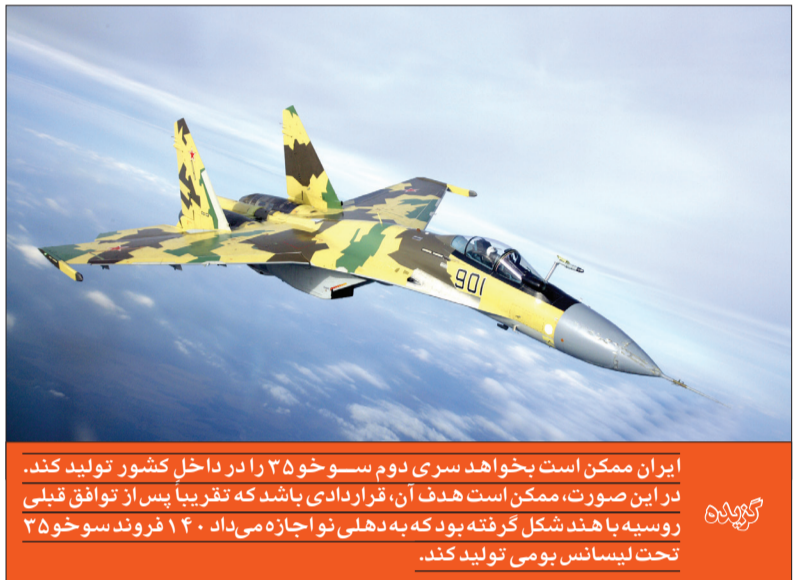
گزینه ایران ممکن است بخواهد سری دوم سوخو ۳۵ را در داخل کشور تولید کند. در این صورت، ممکن است هدف آن، قراردادی باشد که تقریباً پس از توافق قبلی روسیه با هند شکل گرفته بود که به دهلی نو اجازه می‌داد ۱۴۰ فروند سوخو ۳۵ تحت لیسانس بومی تولید کند.

شرایط طبیعی است که روس‌ها هم به دنبال مشتریانی برای صنایع دفاعی خود باشند.