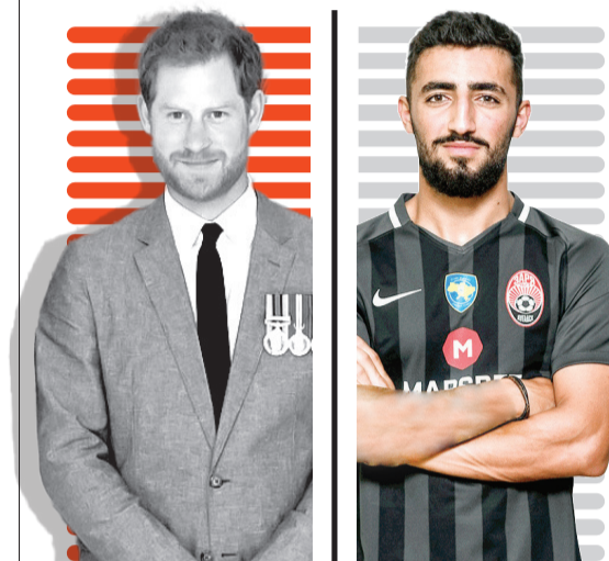
الهیاریصادمتمش در گفت و گو با قدس: تیم ملی ایران مربی بزرگ می خواهد اعتراف پسر شاه اتکلیس به قتل ۲۵ نفر شعطنج خونین شازده در افغانستان!