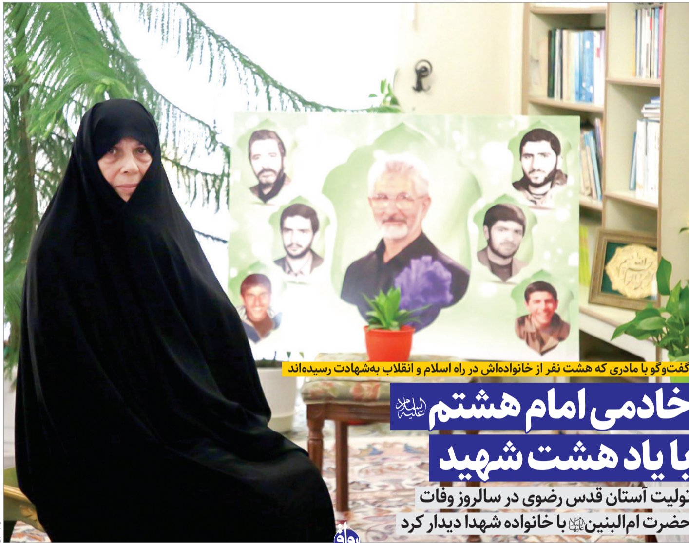
گفت و گو با مادری که هشت نفر از خانواده اش در راه اسلام و انقلاب به شهادت رسیده اند