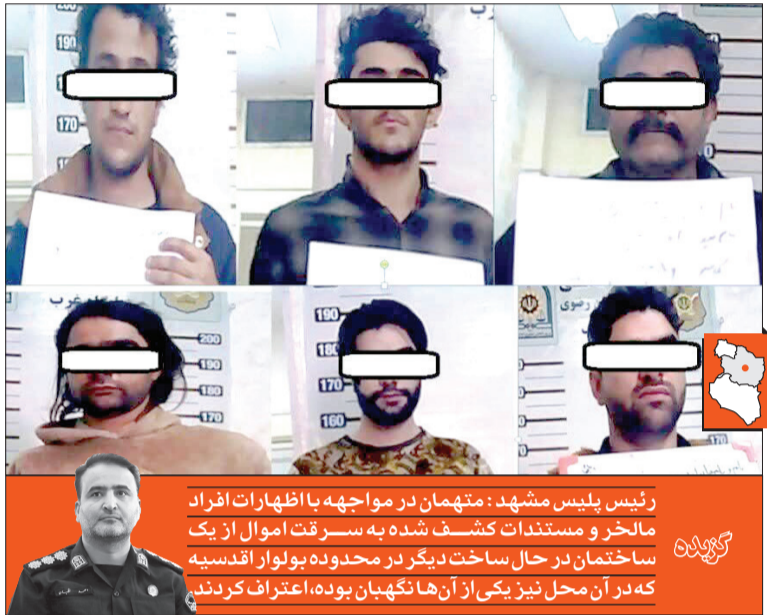
رئیس پلیس مشهد: متهمان در مواجهه با اظهارات افراد مالخر و مستندات کشف شده به سرقت اموال از یک ساختمان در حال ساخت دیگر در محدوده بولوار آندسیه که در آن محل نیز یکی از آن ها نگهبان بوده، اعتراف کردند.

مراجعه کرده و در اجرای نقشه ای از پیش طراحی شده، تمامی لوازم مسروقه را در دو مرحله به انباری در حوالی شهرک شهید رجایی منتقل می کنند.