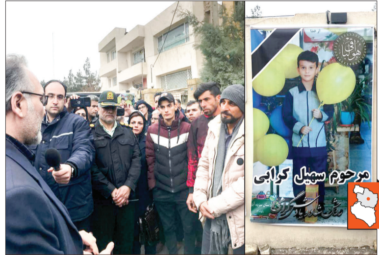
معاون دادستان: بنده حتماً رانندگان پرخطری را که خودروهای آن‌ها توقیف و برای توجیه و شرکت در کلاس‌ها به ما معرفی شده‌اند به این مکان خواهیم آورد تا ببینند رفتار آن‌ها چه عواقب تلخی را در پی دارد، آن‌ها برای خانواده‌ای که به عزیزانش آموزش قانونمداری داده بود.

دیدن صحنه وقوع تصادف آن قدر رنج‌آور بود که اشک در چشمان خبرنگاران حاضر و مسئولان قضایی و انتظامی حلقه زد و تکرار تصاویر و دیدن واقعه دشوار بود.