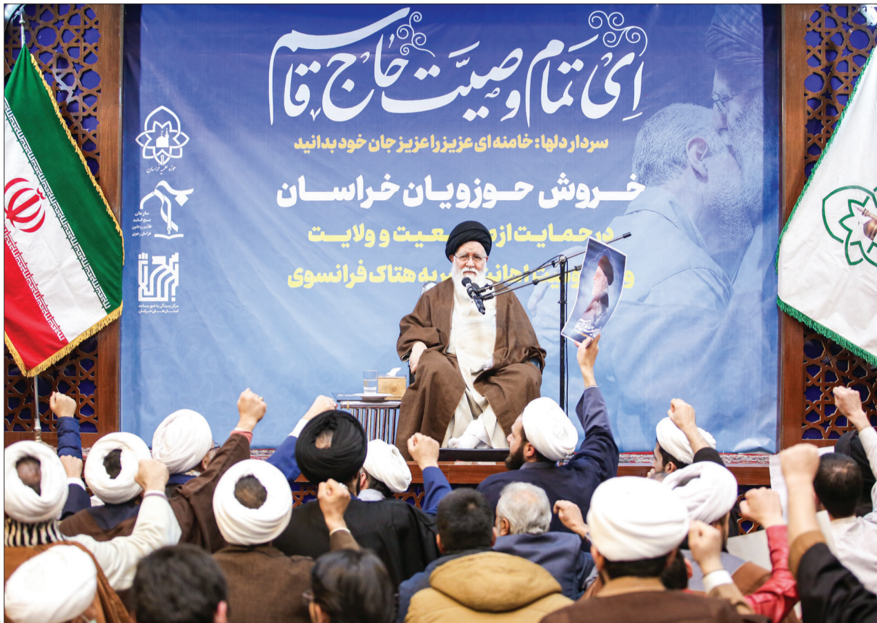
وحید بنیان - فارس

آیت‌الله علم‌الهدی در اجتماع حوزویان خراسان: