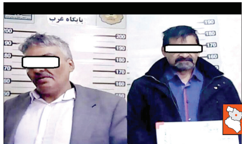
در تحقیقات تکمیلی کارآگاهان پلیس آگاهی مشخص شد هر دو متهم به علت جعل اسناد دو ملک به ترتیب ۳ هزار متری و هزار و ۳۰۰ متری در محدوده اتوبان محمدعلی جناح شهر تهران و شهر کاشمر به ارزش تقریبی ۶۰ میلیارد تومان تحت تعقیب مقامات قضایی هستند.

پیش از هر اقدامی مأموران در بررسی سامانه‌های پلیسی دریافتند یکی از متهمان پرونده مدت‌هاست به جرم جعل و کلاهبرداری تحت تعقیب مقامات قضایی است و برای فرار از چنگال عدالت، دائم مخفیگاهش را تغییر می‌دهد. در نهایت مأموران محل اختفای متهم را هم در حوالی خیابان فرهاد به سرعت شناسایی و پس از هماهنگی با مقام قضایی او را دستگیر کردند.