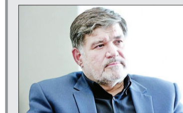
مدیر کل ورزش و جوانان خراسان رضوی ادامه داد: تا به امروز کوتاهی‌های فراوانی از هیئت فوتبال استان مشاهده شده که اگر این موضوع نیز در بررسی‌های ما مورد تأیید قرار بگیرد، بی‌شک با عوامل دخیل در ماجرا برخورد قاطع و قانونی خواهد شد.

همه می‌توانند در این مزایده شرکت کنند؛ اما به موتورسیکلت‌هایی که بالای ۲۵۰ سی‌سی حجم موتور دارند، با توجه به محدودیت‌های موجود، تنها با مجوزهای خاص و موارد خاص مانند هیئت موتورسواری، دستگاه‌های نظامی و... اجازه استفاده داده می‌شود.