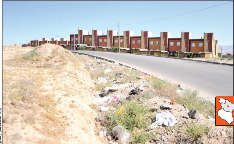
در پروژه‌هایی که الان ساخته می‌شود به دلیل اینکه وام بانکی نسبت به قیمت ساختمان ارزش پایینی دارد، محرومان نمی‌توانند واقعا صاحب خانه شوند.

این فعال حوزه ساختمان ضمن تأکید بر خالی بودن جای مطالعات در عرصه ساخت مسکن، گفت: علت این است که مطالعات فرهنگی، اجتماعی و اقتصادی در پروژه‌های مسکن انجام نمی‌شود و تنها ساخت مسکن مهم است؛ اما آیا این الزام در پروژه‌ها وجود دارد که مسکن‌ها به خانواده‌ها برسد و بازی از دوش دولت برداشته شود یا فقط ارائه آمار و گزارش مهم است؟ وی در پایان متذکر شد: این ۴۰۰ هزار واحد