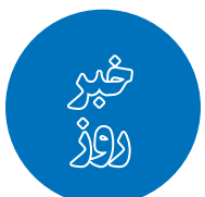
سر مربی ایرانی در آستانه جدایی از عراق

فدراسیون کشتی قصد دارد در نظرسنجی مردمی، برترین کشتی‌گیر سال ۱۴۰۱ را انتخاب کند که در این بین نامی از پادشاه کشتی جهان نیست. در این نظرسنجی نام هشت کشتی‌گیر آمده است.