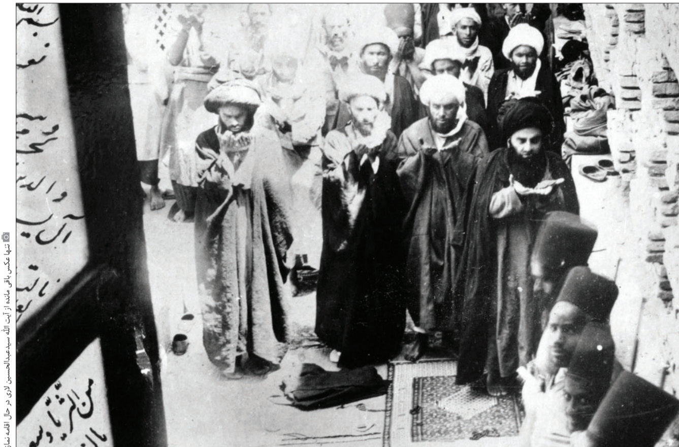
تصویری از آیت‌الله‌العظمی سیدعبدالحسین لاری در حال نماز