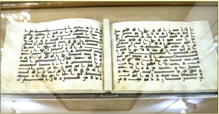
نسخه‌های قرآنی جهان اسلام و ایران را تشکیل می‌دهند که سازمان کتابخانه‌ها، موزه‌ها و مرکز اسناد آستان قدس رضوی حافظ آن‌ها برای نسل‌های آینده است.

به گزارش آستان‌نبوز، گنجینه رضوی با دارا بودن حدود ۲۳هزار قرآن و جزوه قرآنی؛ از صدر اسلام تاکنون، یکی از غنی‌ترین کتابخانه‌های ایران و جهان اسلام در حوزه آثار قرآنی است؛ آثاری که در طول قرون‌متمادی در پرتو سنت‌های وقف، نذر یا اهدا توسط ارادتمندان حضرت