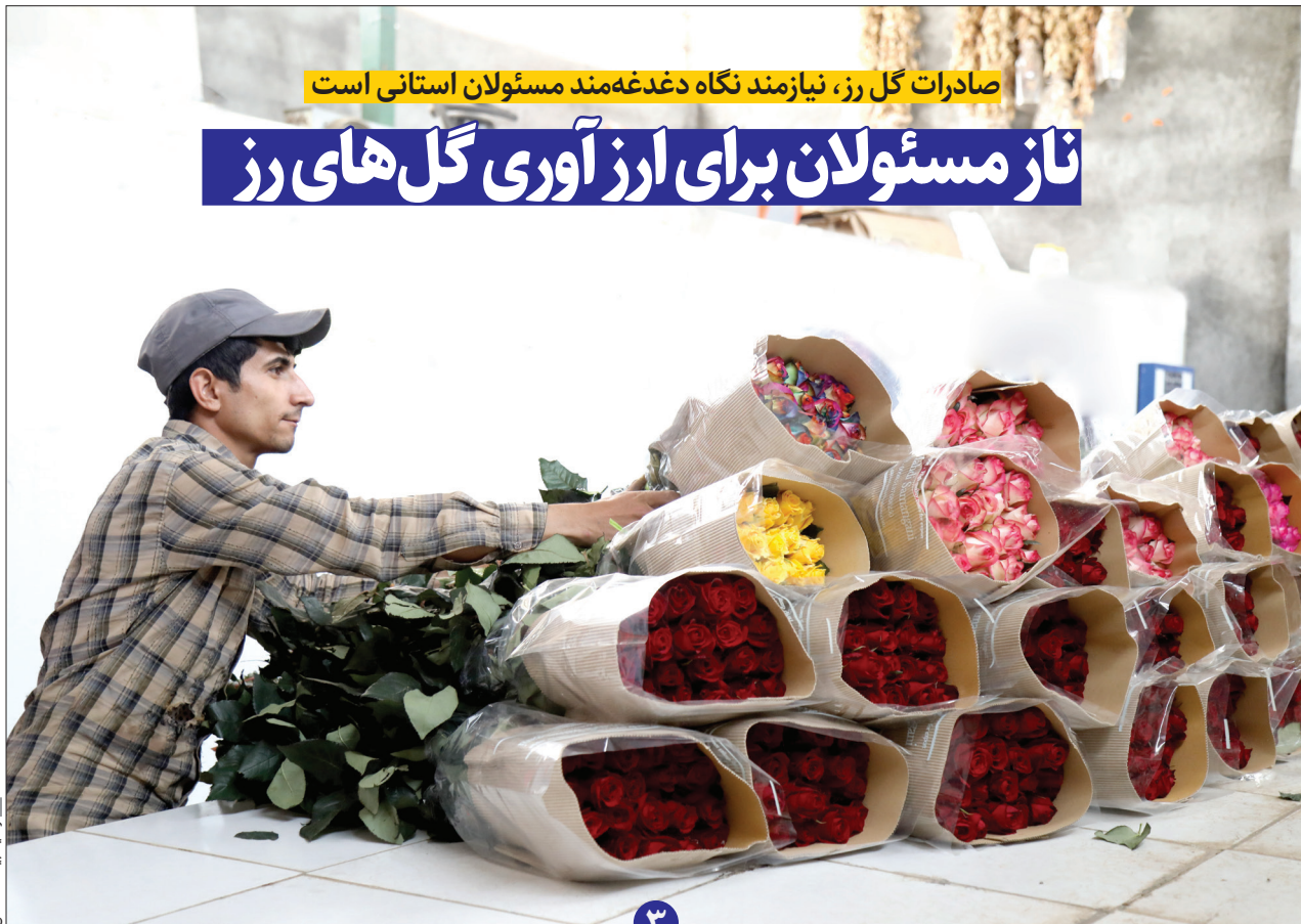
عبدالرضا - بازار - قدس

صادرات گل رز، نیازمند نگاه دغدغه‌مند مسئولان استانی است