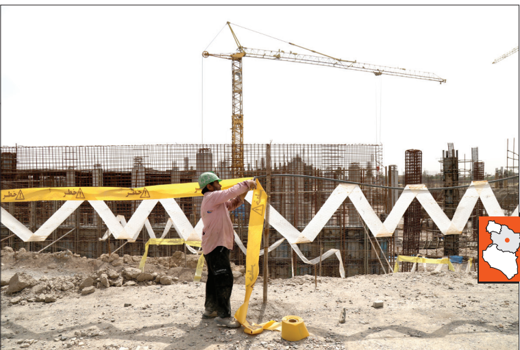
اکنون یک بیمارستان ۴۰۰ تختخوابی ویژه اعصاب و روان با پیشرفت ۲۰ درصدی در منطقه الهیه در حال ساخت است.

رئیس کمیسیون ویژه ساماندهی حاشیه شهر شورای شهر مشهد با بیان اینکه ما به شدت به دنبال این هستیم تا سرانه بهداشتی و درمانی در حاشیه شهر را افزایش دهیم، یادآور شد: شورای چهارم شهر مشهد تفاهم‌نامه‌ای با وزیر بهداشت وقت منعقد کرد و متعهد شد در صورتی که دانشگاه علوم پزشکی مشهد زمین بیمارستان قائم را در اختیار شهرداری قرار دهد، شهرداری سه بیمارستان در حاشیه شهر بسازد تا هم سرانه‌ها در این مناطق تأمین و هم بار تجمع مراکز بهداشتی از مرکز شهر مشهد برداشته شود؛ اما دانشگاه علوم پزشکی هیچ‌وقت به این تفاهم‌نامه عمل نکرد.