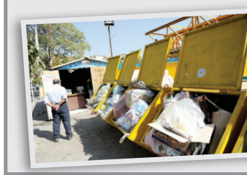
افرادی که غیرمجاز زباله‌گردی کرده و خرید و فروش می‌کنند، در نظر گرفته شود.

از ۹۰ درصد سرمایه‌گذاری در استان مربوط به بخش خصوصی است. استان ما استانی رو به توسعه بوده و سالانه بیش از ۳۰ میلیون زائر به آن سفر می‌کنند. در خراسان رضوی ظرفیت ملی وجود داشته و به همین دلیل باید بخش حاکمیتی به صورت ویژه نیازهای استان را پیگیری کند.