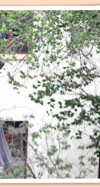
عصا و سبها