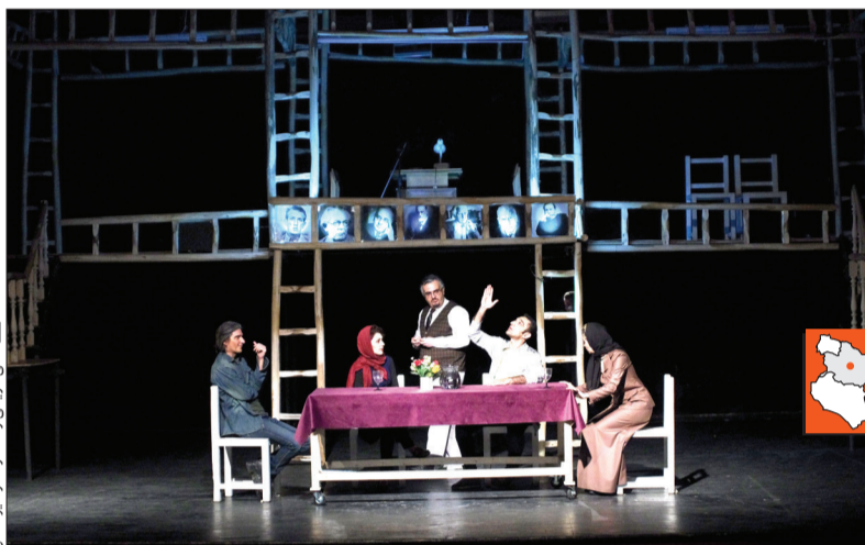
تئاتر در خراسان رضوی

محمد حه مودی | مشهد را با وجود هنرمندان توانمند و آثار نمایشی شاخص، می‌توان یکی از قطب‌های هنرهای نمایشی در کشور دانست. ظرفیت ویژه مشهد در تولید آثار آیینی و مذهبی نیز نکته‌ای است که باید به آن توجه ویژه داشت.