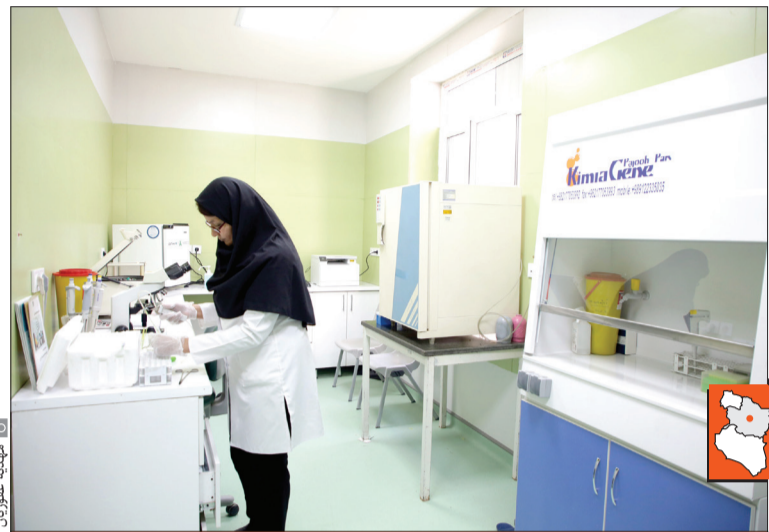
با توجه به اینکه ازدواج و باروری در سنین بالا بیشتر شده آمار ناباروری نسبت به سال‌های گذشته افزایش پیدا کرده است. میزان ناباروری در مشهد نسبت به سال‌های گذشته ۵ درصد افزایش داشته است.