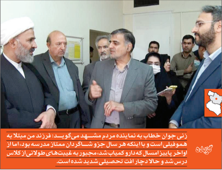
زنی جوان خطاب به نماینده مردم مشهد می‌گوید: فرزند من مبتلا به هموفیلی است و با اینکه هر سال جزو شاگردان ممتاز مدرسه بود، اما از اواخر پاییز امسال که دارو کمیاب شد، مجبور به غیبت‌های طولانی از کلاس درس شد و حالا دچار افت تحصیلی شدید شده است.

اینکه هر سال جزو شاگردان ممتاز مدرسه بود اما از اواخر پاییز امسال که دارو کمیاب شد مجبور به غیبت‌های طولانی از کلاس درس شد و حالا دچار افت تحصیلی شدید شده است مسئولان مدرسه هم متوجه نیستند بچه‌ای در این شرایط وقتی به خاطر نبود دارو در خانه می‌ماند از درد به خود می‌پیچد.