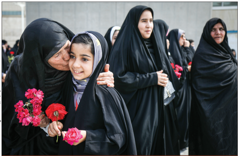
هر چه به حرم نزدیک‌تر می‌شدی، نوای «خوش آمدی حضرت معصومه» دختران و بانوان مشهدی بلندتر می‌شد. در حرم مطهر نیز خادمان به استقبال عاشقان کریمه اهل بیت(ع) آمده بودند. ارادتمندان امام(رضاع) با ورود به حرم رضوی، شاخه‌های گل را به آستان آن حضرت تقدیم کردند.

تجدید بیعت با کریمه اهل بیت(س)، در مراسم گلباران حرم مطهر شرکت کرده بودند. در پیاده‌رو خیابان‌های منتهی به حرم، مردان نیز با بانوان مشهدی هم‌نوا و همراه شده بودند. مردم با نوای «یا مولاتی، اخت‌الرضا مدد» و «مدد یا فاطمه» به سمت حرم مطهر امام(رضاع) حرکت می‌کردند. خادمان آستان قدس رضوی نیز با آن‌ها در مسیر همراه شده بودند.