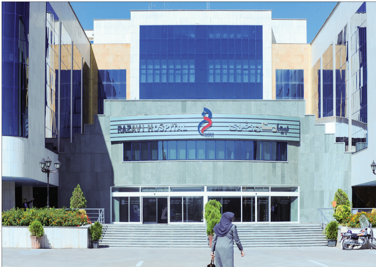
عسل کریمی سنگار - آرسو قدس