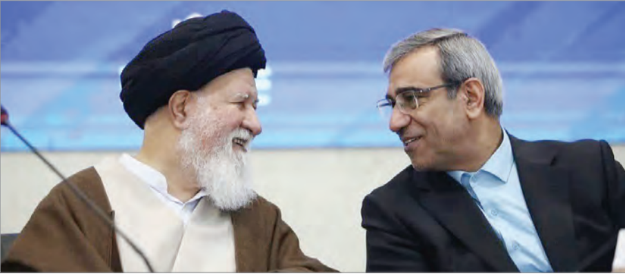
پختگی بیشتر است. همچنین نیازمند تقید به حل مشکل است. ما در استان از این اصول برخورداریم. آقای استاندار جزئیات مسائل خراسان رضوی مسلط است. مقید به حل مشکلات استان بوده و به دلیل بومی بودن به