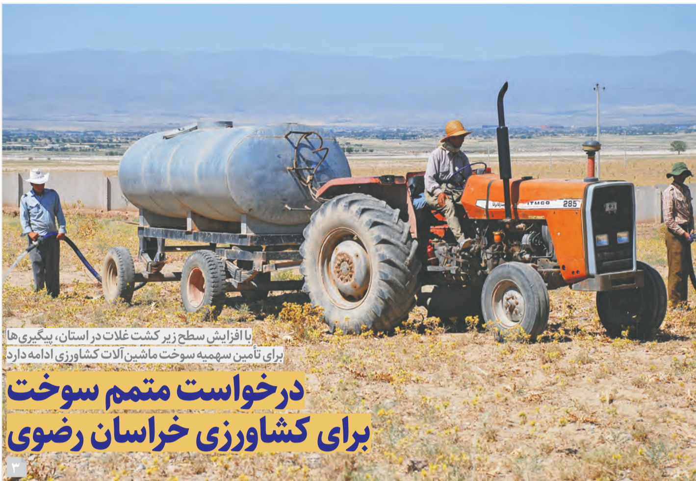
با افزایش سطح زیر کشت غلات در استان، پیگیری‌ها برای تامین سهمیه سوخت ماشین‌آلات کشاورزی ادامه دارد