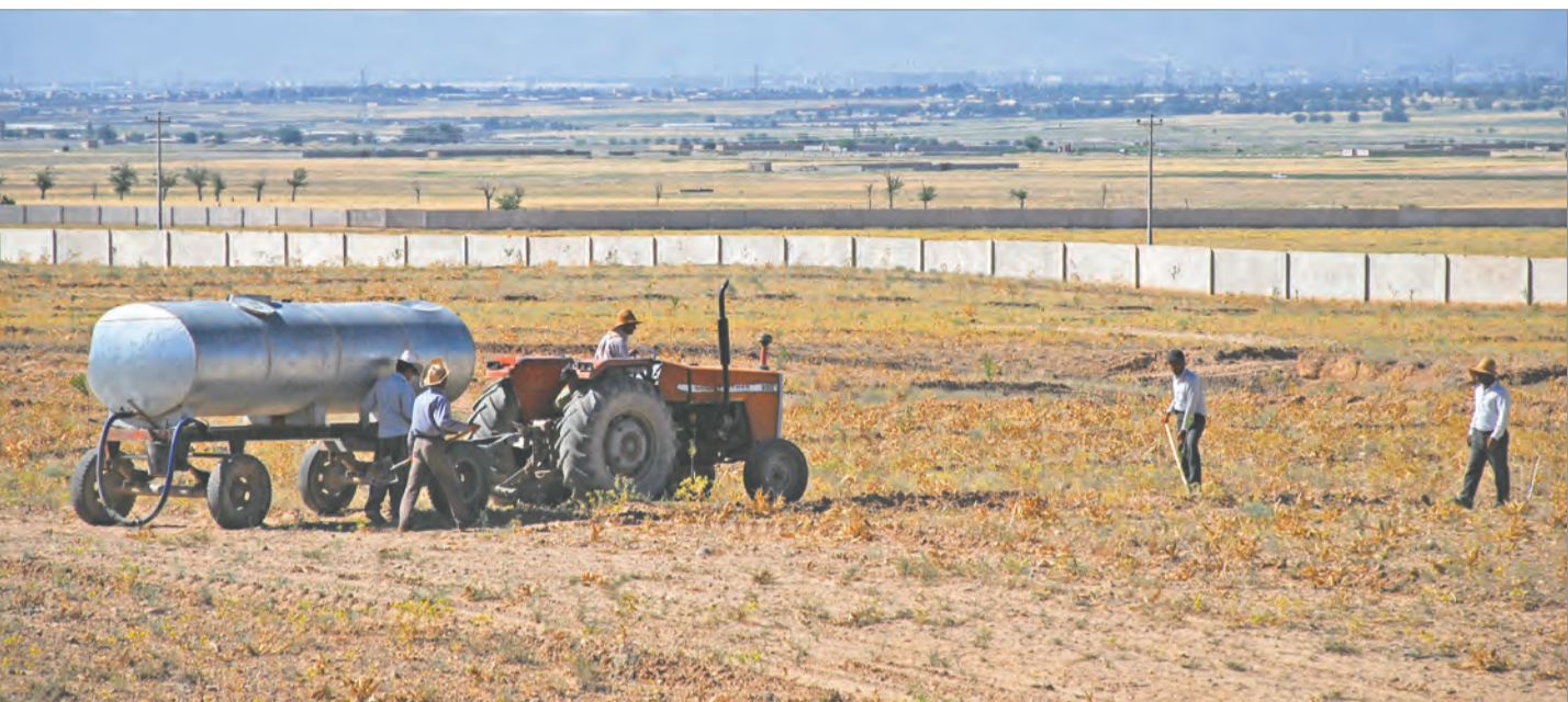
محمدحسین رضایی - آرزوی قلم

که به رؤیت خبرنگار طوس رسید، تصریح کرد: کمیسیون استانی همچنان خودامصرانه مسئول پیگیری مطالبه‌بحق کشاورزان عزیز و دارندگان ادوات کشاورزی در استان می‌داند و در این راه در کنار سایر دستگاه‌های متولی از هیچ کوششی دریغ نخواهد کرد. دبیر کمیسیون برنامه‌ریزی، هماهنگی و مبارزه با قاچاق کالا و ارز خراسان رضوی ادامه داد: در نتیجه نشست‌های تخصصی با کارشناسان جهاد کشاورزی و فعالان بخش کشاورزی به این باور رسیده‌ایم که سوخت تخصصی به استان به میزانیکه ذکر شد، کارشناسی شده نبوده و از منطق علمی برخوردار نیست. از این رو باید دوباره یادآور شد در کنار سایر متولیان امر، نه تنها پیگیری جذب ۲۶ درصد سوختی که از سهمیه تخصیص استانی محقق نشده، هستیم؛ بلکه افزایش آن و متمرکز سوخت نیز خواسته ماست.