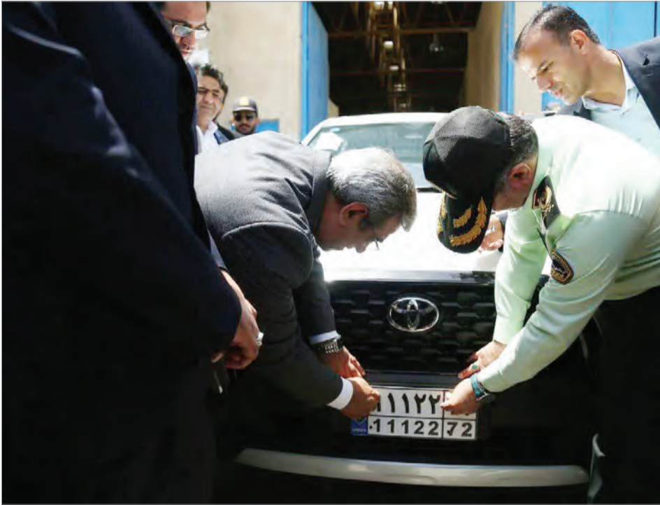
اداره کل روابط عمومی استانداری خراسان رضوی

کرد. بنابراین، تا پیش از انتشار رسمی این فراخوان، هرگونه تبلیغ، آگهی پیش‌فروش یا پلاک‌گذاری در سایت‌های فروشگاهی یا فضای مجازی فاقد وجاهت قانونی است.