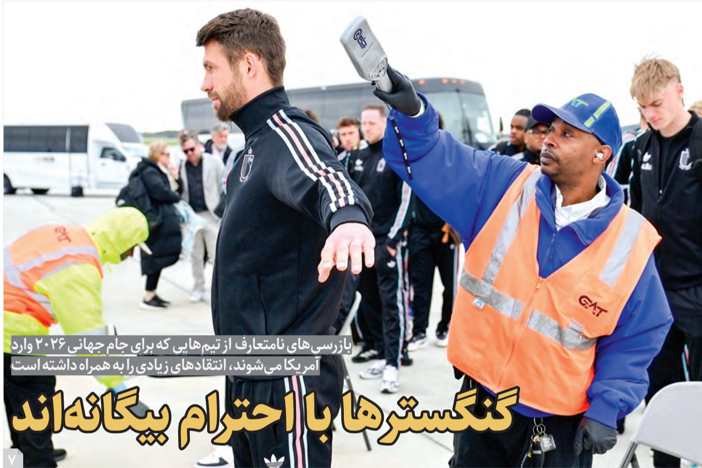
بازرسی‌های نامتعارف از تیم‌هایی که برای جام جهانی ۲۰۲۶ وارد آمریکا می‌شوند، انتقادهای زیادی را به همراه داشته است