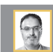
یادداشت جواد نوائیان رودسری