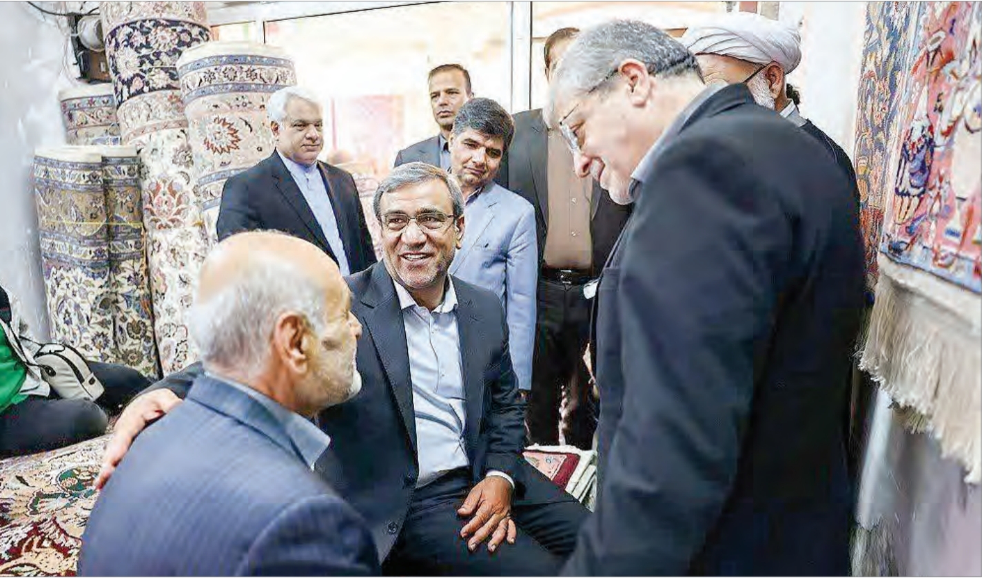
اداره کل روابط عمومی استانداری خراسان رضوی