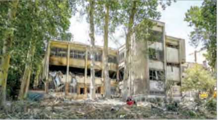
جنایتکارانی که به زندانیان هم رحم نکردند

۲ تیر ۱۴۰۴ و در روزهای پایانی جنگ ۱۲ روزه زندان اوین نیز هدف حمله رژیم صهیونیستی قرار گرفت و بخش‌های نگهبانی، اداری و دادسرای اوین، بند نسوان، ساختمان بهداری و کتابخانه بند چهار در این حمله آسیب دیدند. حمله‌ای که ۷۱ نفر شامل کارمندان اداری، سربازان وظیفه، زندانیان و خانواده زندانیان که برای ملاقات یا پیگیری قضایی به زندان مراجعه کرده بودند، در آن کشته هستند. حمله‌ای که مقامات رژیم صهیونیستی در توجیهی بی‌شمرانه هدف آن را آزادی زندانیان سیاسی عنوان کردند، توجیهی که با واکنش یکی از زندانیان مشهور این زندان همراه شد. نرگس محمدی که به واسطه تبلیغات منفی اش علیه جمهوری اسلامی ایران، جایزه صلح نوبل را دریافت کرده است، نوشت: «حملة اسرائیل که در روز روشن، در مقابل خانواده‌ها و بازندگان کشتگان انجام شد، آشکارا یک جنایت جنگی است.»