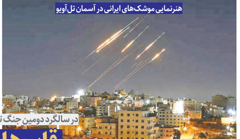
هنرنمایی موشک‌های ایرانی در آسمان تل‌آویو

در سالگرد دومین جنگ تحمیلی، مروری داشتیم بر تصاویر تلخ و شیرینی که در حافظه جمعی ایرانیان به جا مانده است