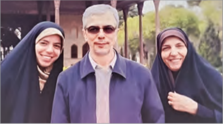
تصویری متفاوت از آزادگی

جنگ ۱۲ روزه و شهادت اعضای خانواده و فرزندان برخی از فرماندهان و مسئولان، تصویر صددرصد منفی از مفهوم آزادانه را تغییر داد. تا پیش از این تصویر ایجاد شده از فرزندان مسئولان به واسطه سوءاستفاده‌های تعدادی از آقا‌زاده‌های شخصیت‌ها، تصویری کاملاً منفی بود و انگاره فساد سیستماتیک در کشور را پررنگ کرد، اما شهادت فرزندان برخی فرماندهان و مسئولان این انگاره را تغییر داد. فرشته باقری، فرزند شهید محمدباقری فرمانده ستاد کل نیروهای مسلح کشورمان که بدون تشریفات و رانت در فضای رسانه کار می‌کرد، در رأس آقا‌زاده‌های شهید بود. اما جنگ رمضان چهره‌های مهم دیگری را در این عرصه معرفی کرد. شهادت یک دختر، یک عروس، یک داماد و یک نوه رهبر شهید انقلاب در روز آغاز جنگ رمضان، شهادت فرزند شهید لاریجانی و... نشان داد که پدیده آزادگی عمومیت ندارد.