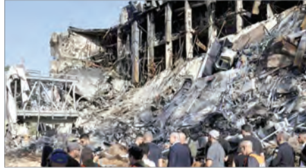
وایزمن؛ هوش سیاه صهیونیستی در آتش

حملات جمهوری اسلامی ایران به خاک رژیم صهیونیستی اگرچه با سانسور خبری شدید این رژیم پادگانی همراه بود، اما اخبار اصابت‌ها به‌ویژه در بخش‌های مهم و استراتژیک این رژیم قابل کتمان نبود. یکی از مهم‌ترین اهدافی که موشک‌های ایران توانستند به آن دست پیدا کنند، مؤسسه علوم وایزمن در شهر رجوفت در جنوب تل‌آویو بود. این مؤسسه میزبان حدود ۲ هزار و ۵۰۰ پژوهشگر و کارمند بود و برنامه‌های پیشرفته کارشناسی ارشد و دکتری در رشته‌هایی چون ریاضیات، فیزیک، زیست‌شناسی، شیمی و علوم کامپیوتر ارائه می‌داد. یک موشک شلیک شده از خاک ایران توانست در روز ۲۴ خرداد با عبور از پدافند هوایی اسرائیل ضربی‌های به‌یک‌ای از مهم‌ترین مراکز علمی اسرائیل و جهان وارد کند و به گفته رئیس شورای علمی این مؤسسه، ۵۰ آزمایشگاه آن کاملاً نابود شد. اگرچه وایزمن در ظاهر یک نهاد علمی بود، اما در عمل بخشی از زیرساخت امنیت ملی اسرائیل به‌شمار می‌رفت. این مؤسسه نقش محوری در پشتیبانی فناوریانه از ارتش اسرائیل ایفا می‌کرد و مهم‌ترین کارکردهای این مؤسسه شامل توسعه سامانه‌های پیچیده نظامی با تکیه بر هوش مصنوعی، پیشرفت در فناوری پهپادها و سامانه‌های خودران، ابزارهای پیشرفته ردگیری الکترونیک، جنگ الکترونیک و اختلال در سامانه‌های دشمن، فناوری‌های نویری جایگزین جی‌پی‌اس در مناطق جنگی و رمزگذاری ارتباطات نظامی در محیط‌های درگیری از جمله خدمات علمی این مرکز به ماشین جنایت جنگی رژیم صهیونیستی بود که در این جنگ از بین رفت.