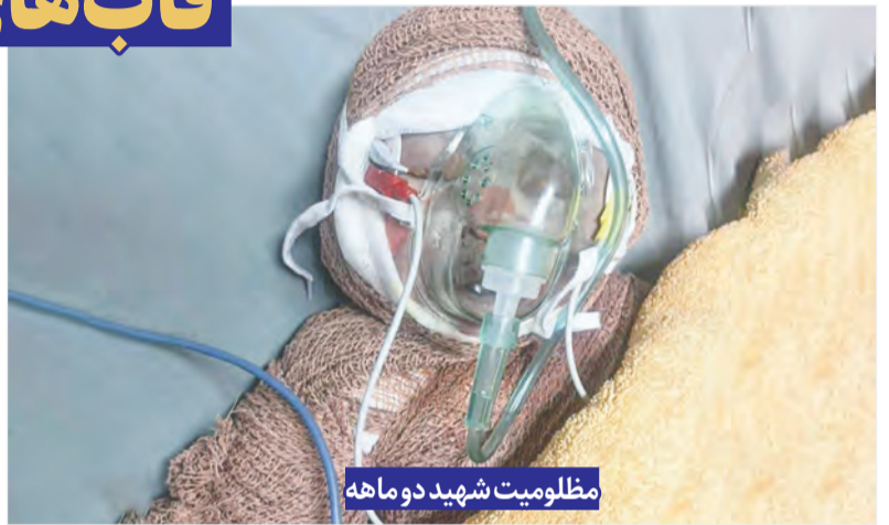
مظلومیت شهید دو ماهه

در کنار اشک‌ها و لبخندها در جام جهانی، چه پیامدهای انسانی زیر پوست جهان جاری شده است؟ خارج از مستطیل سبز