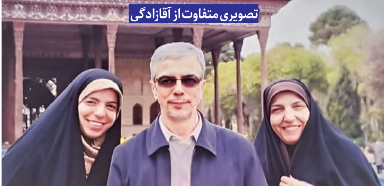
تصویری متفاوت از آزادگی