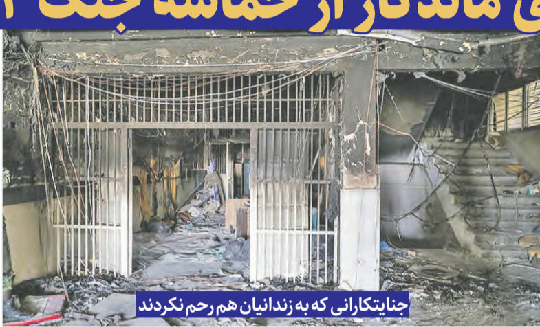
جنايت‌کارانی که به زندانیان هم رحم نکردند