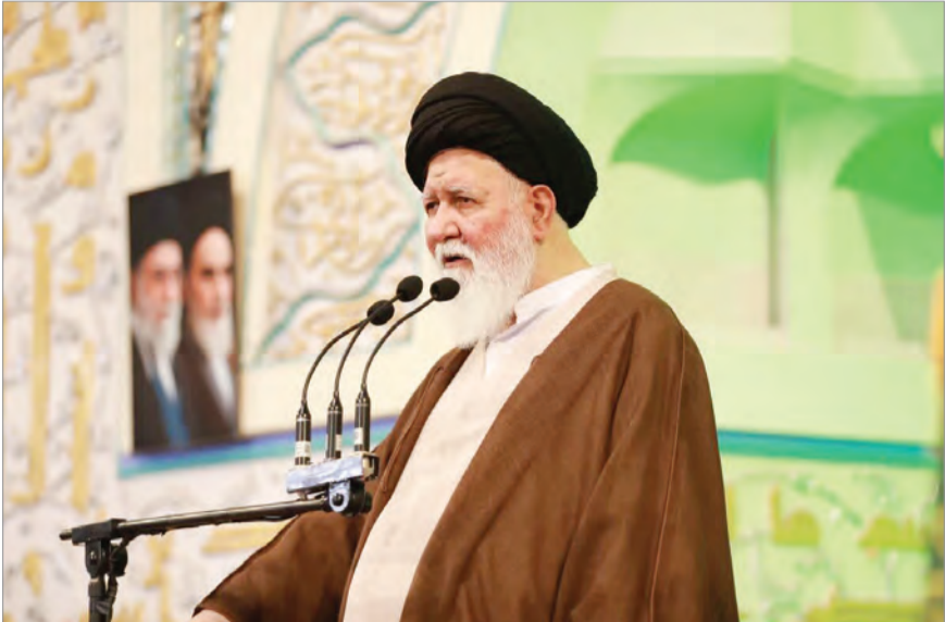
پایگاه اطلاع‌رسانی هیاتمدته رهبری