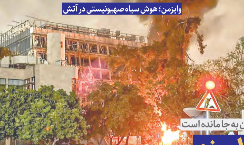
وایزمن؛ هوش سیاه صهیونیستی در آتش

شنبه ۲۳ خرداد ۱۴۰۵ ۲۷ ذی الحجه ۱۴۴۷ ۱۳ ژوئن ۲۰۲۴ سال سی و نهم شماره ۱۰۹۵۰ ۸ صفحه سراسری + ۸ صفحه روزنامه استانی قیمت ۱۰۰۰۰ تومان