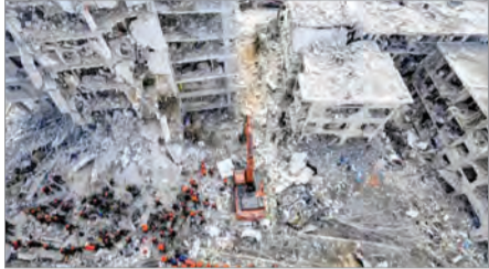
هنرنمایی موشک‌های ایرانی در آسمان تل‌آویو

اگرچه سانسور، یکی از اجزای جدایی‌ناپذیر در پادگان بزرگی به نام رژیم اسرائیل و جغرافیای آن است، اما به تدریج پس از اتمام جنگ ۱۲ روزه جزئیات بیشتری از خسارت‌های این رژیم در این جنگ منتشر شد. اداره مالیات رژیم صهیونیستی اعلام کرد در جنگ با ایران ۴۱ هزار و ۶۵۱ پرونده خسارت مربوط به ساختمان‌ها، خودروها و سایر اموال شهروندان اسرائیلی ثبت شد. هزینة ۱۶ میلیارد دلاری جنگ، خسارت ۳ میلیارد دلاری ناشی از حملات جمهوری اسلامی ایران، افت چشمگیر ذخایر موشک‌های پدافندی این رژیم و کشته شدن ۶ ژنرال، ۳۲ فرمانده، ۱۱ دانشمند و ۳۰۰ افسر بخشی از خسارت‌های مادی این جنگ برای سردمداران رژیم کودک‌کش صهیونیستی بود، اما هزینه‌های معنوی این جنگ چشم‌گیرتر بود. شکسته شدن هیمنه نظامی رژیم صهیونیستی، نفوذ مداوم موشک‌های ایران به آسمان رژیم و از بین بردن امنیت روانی ساکنان آن، خدشه‌دار شدن تصویر همواره غالب نظامی این رژیم در منطقه، بازتاب گسترده تصاویر نفوذ موشک‌های ایرانی به قلب سرزمین‌های اشغالی، پناه بردن مداوم شهرک‌نشینان صهیونیست به پناهگاه‌ها و فرو ریختن نقاب قدرت پوشالی این رژیم در برابر چشم جهانیان خسارت‌هایی است که قابل اندازه‌گیری نیست و حیات این رژیم جعلی را بیش از پیش در معرض خطر قرار می‌دهد.