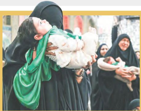
همایش شیرخوارگان حسینی در حرم مطهر رضوی با حضور مادران و نوزادانشان برگزار شد