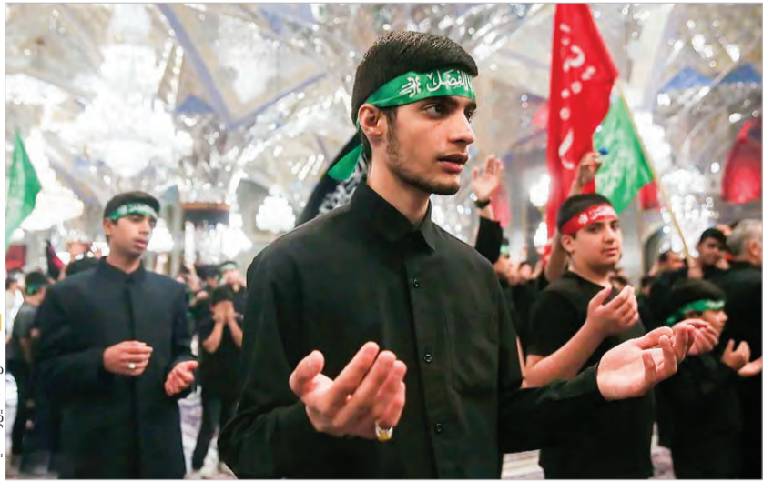
حضور سیدالشهدا (ع) در کربلا

در این باره می‌گوید: «مرگ هر کس ای پسر همرنگ اوست پیش دشمن دشمن و بر دوست دوست» و در جایی دیگر می‌فرماید: «ای که تو از مرگ می‌ترسی اندر فرار تو ز خود ترسی نه از مرگ، ای هوشیار». این سخن نشان می‌دهد اگر کسی از مرگ می‌ترسد، در حقیقت از ماهیت مرگ نمی‌ترسد، بلکه از حقیقت خود می‌هراسد؛ چرا که انسان در لحظه مرگ به نوعی «معاینه حقیقت» می‌رسد و با چهره واقعی شخصیت خود روبه‌رو می‌شود. در آن هنگام، وجوه واقعی وجود انسان آشکار می‌شود. بنابراین اگر مرگ برای کسی زیبا و دلنشین است، این زیبایی ریشه در شیوه زندگی او دارد. کسی که درست و در مسیر حقیقت زندگی کرده باشد، مرگ را نیز زیبا می‌بیند. در واقع حضرت قاسم (ع) با همان پاسخ کوتاه اما عمیق خود به ما می‌آموزد انسان باید چنان زندگی کند که مرگ برای او جلوه‌ای زیبا و دلپذیر داشته باشد.