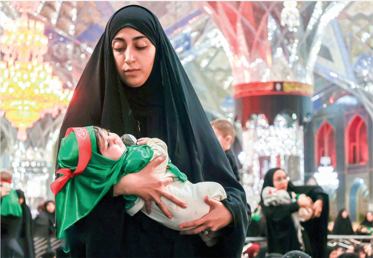
سیدة تنظیم سیدزین‌آباد