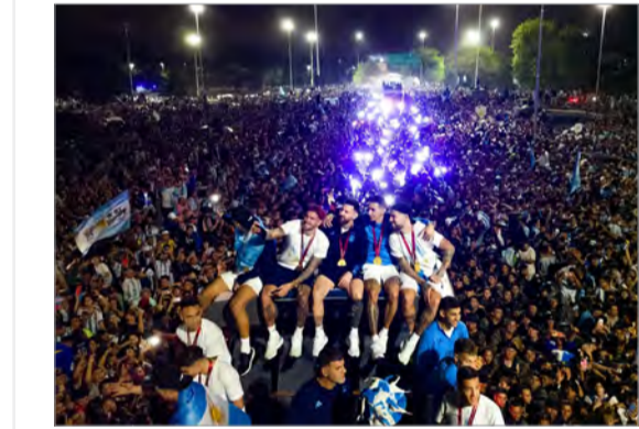
طرفداران تیم فوتبال آرژانتین در قطر، ۲۰۲۲

اگر در این مطلب نشانه‌هایی از اعتقاد به دعا و توسل به متافیزیک را نزد تماشاگران و طرفداران تیم‌های جام جهانی دیدیم معنی‌اش این نیست که توسل به جادو و جنبل توسط طرفداران یا بازیکنان و کادر فنی را هم تأیید می‌کنیم. معلوم است که ورزشکاران و مربیان باید اول اتکانشان به توانایی‌های فنی، تاکتیک و علم روز و بعد به غیرت، تعصب، دعا و توسل باشد. یعنی «دعا» و طلب موفقیت کردن از خداوند، حساسبش