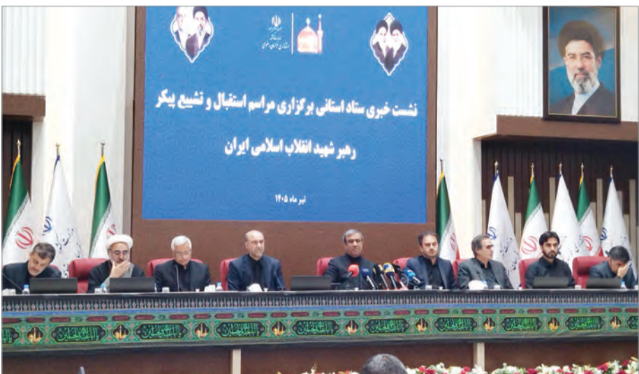
پیش‌بینی شده است.

معاون سیاسی اجتماعی استاندار خراسان رضوی درباره فعالیت‌های انجام شده در بخش دانشگاهیان توضیح داد: پیرو تصمیم ستاد مرکزی مبنی بر حضور دانشگاه‌های شرق کشور در مشهد حضور دانشگاه‌های غرب و جنوب در مراسم تهران و قم، محوریت این بخش در استان بر عهده دانشگاه فردوسی است. طبق سامانه وزارت علوم، تا صبح امروز ۲۲ هزار نفر اعلام آمادگی کرده‌اند که از این تعداد، ۱۳ هزار نفر در چند روز اخیر به استان منتقل شده‌اند و ظرفیت اسکان دانشگاهی برای پذیرایی از ۵۰ هزار دانشجوی استاد فراهم شده است.