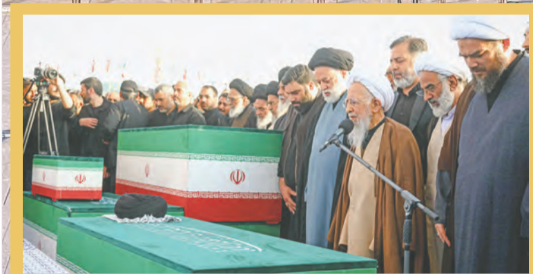
درباره نمازهای آیات عظام سبحانی و جوادی آملی بر پیکر مطهر رهبر شهید انقلاب در گفتگو با آیت الله علی دوست در نماز خم ابروی تو در یاد آمد